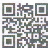
มติคณะรัฐมนตรี (๓ ก.ค. ๖๑)