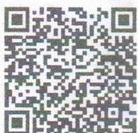
พระบรมฉายาลักษณ์

๓. สอบถามรายละเอียดเพิ่มเติมได้ที่ กลุ่มงานอาลักษณ์ กองอาลักษณ์และเครื่องราชอิสริยาภรณ์ สำนักเลขาธิการคณะรัฐมนตรี โทร. ๐ ๒๒๘๐ ๙๐๐๐ ต่อ ๑๘๒๒ - ๑๘๒๓